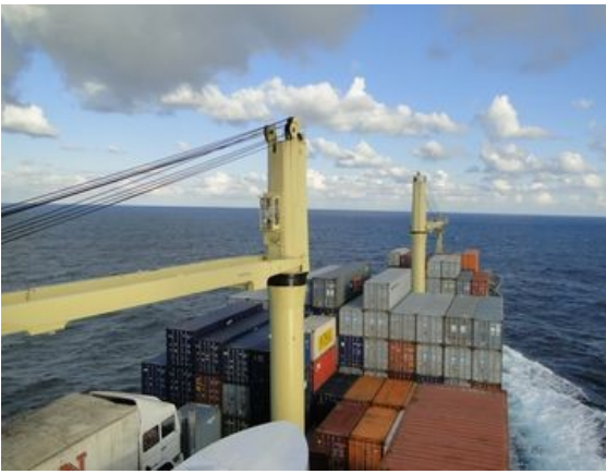
Blick von der Kommandobrücke