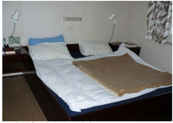
Der Schlafraum der Eignerkabine