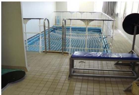
Innenpool mit kleinem Fitnessraum