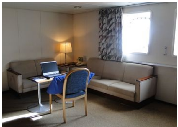
Der Wohnbereich der Eignerkabine...