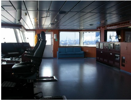
Ein Teil der grossen Kommandobrücke