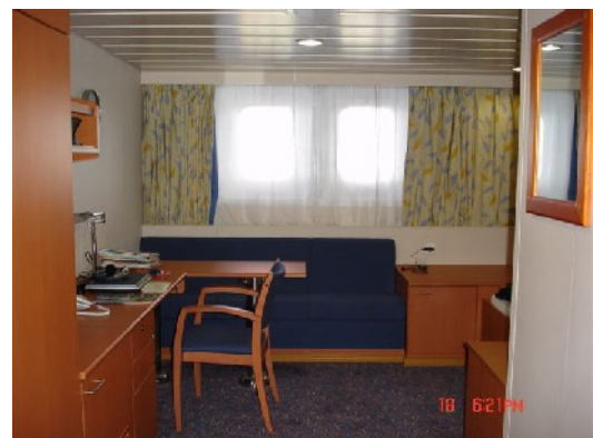
Die Supercargo-Kammer, die Koje ist rechts hinten