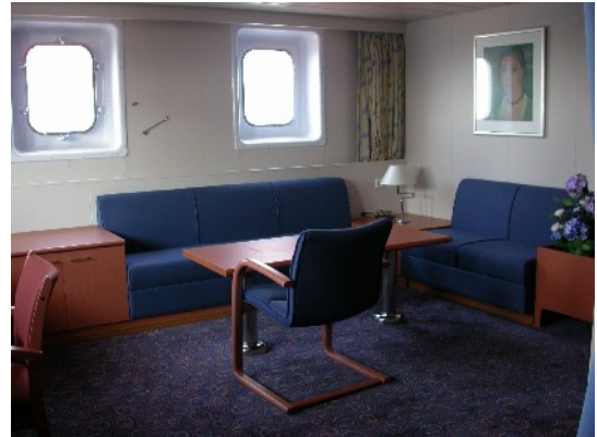
Wohnraum der Zahlmeister-Kabine