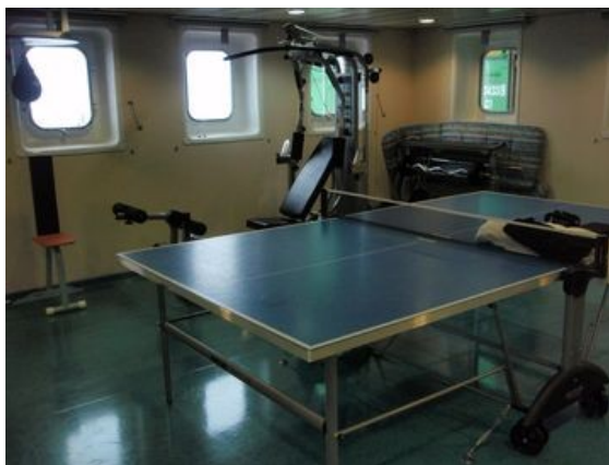
Der ziemlich gut ausgestattete Sportraum