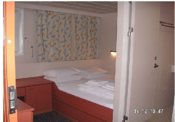
Schlafrum der Eignerkabine