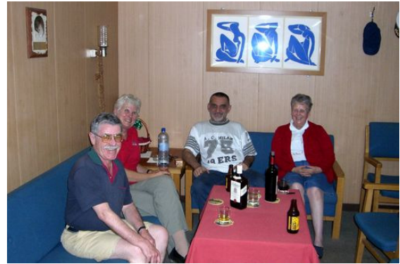
Bei einem Drink in der Kapitänskabine