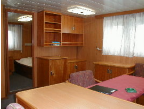
Blick in die Supercargo-Kammer