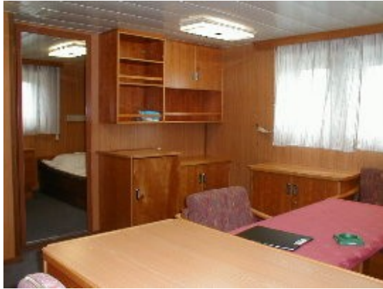
Blick in die Supercargo-Kammer