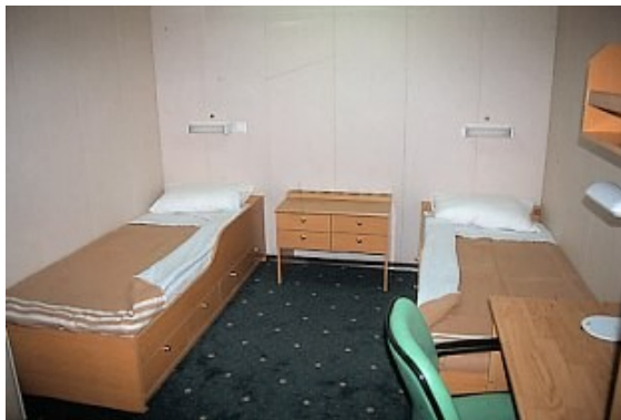
Eine der Innenkabinen