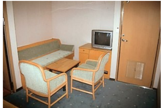
Der Wohnraum der Eignerkabine