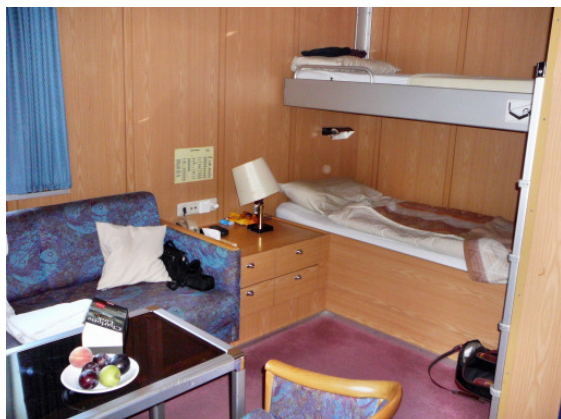
Blick in eine der sechs Doppelkabinen