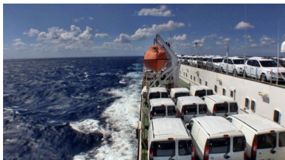
Die vollbeladene Fides im Mittelmeer