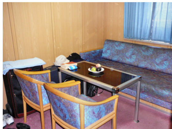
Die Sitzecke in der Kabine