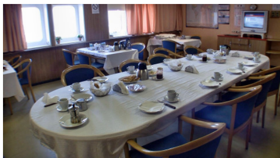
Die Offiziersmesse, wo auch die Passagiere speisen