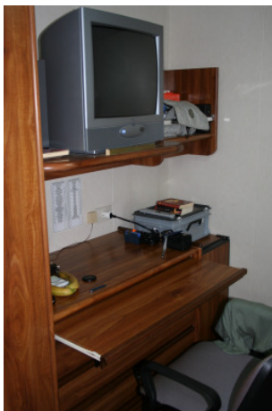
Das Schreibpult in der Innenkabine