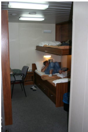
Eine der Innenkabinen