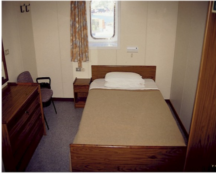
Der Schlafraum der Eignerkabine