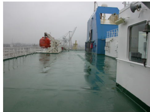
Viel Decksfläche lädt zum Spazieren ein