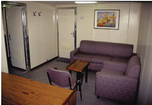
Der Wohnraum der Eignerkabine