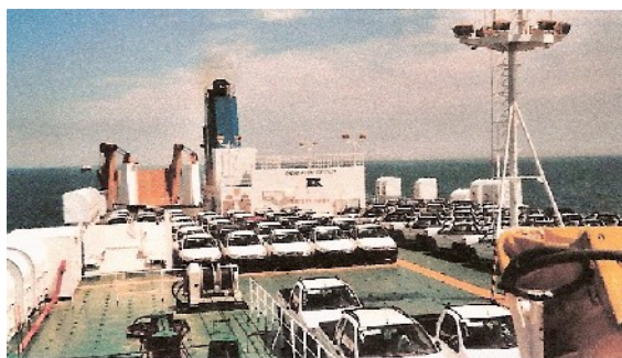
Blick von der Kommandobrücke nach achtern.