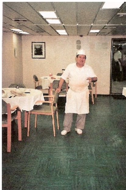
Der Koch, ein sehr wichtiges Mannschaftsmitglied!