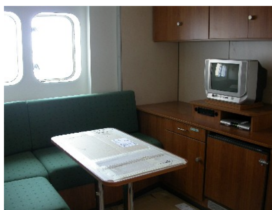
Der Wohnraum der Kabine "704"