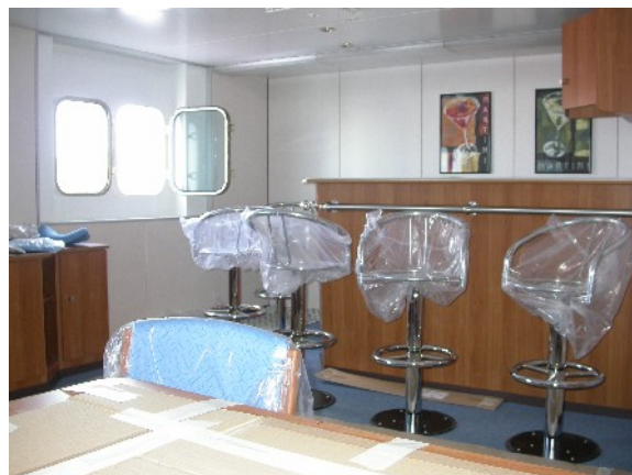
Die Bar im Aufenthaltsraum