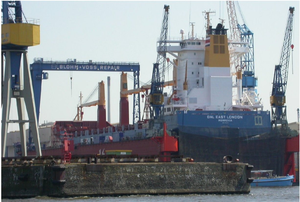
Das Schiff wenige Tage vor der Inbetriebnahme im Dock in Hamburg