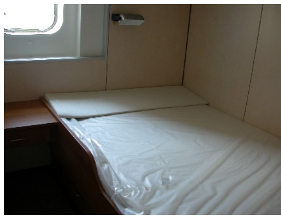
Der Schlafraum der Kabine "704"