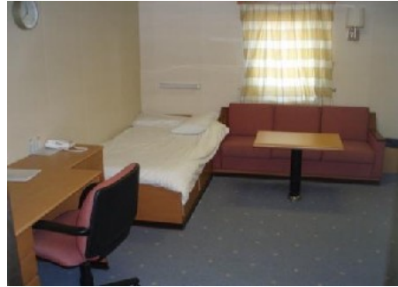
Kabine „Radio Officer“