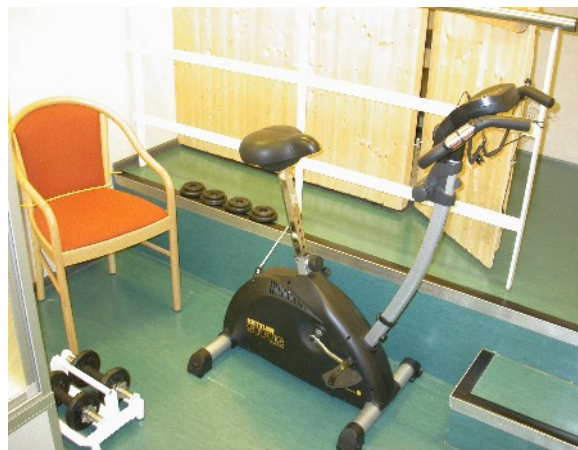
Der sehr kleine "Sportraum" mit Sauna