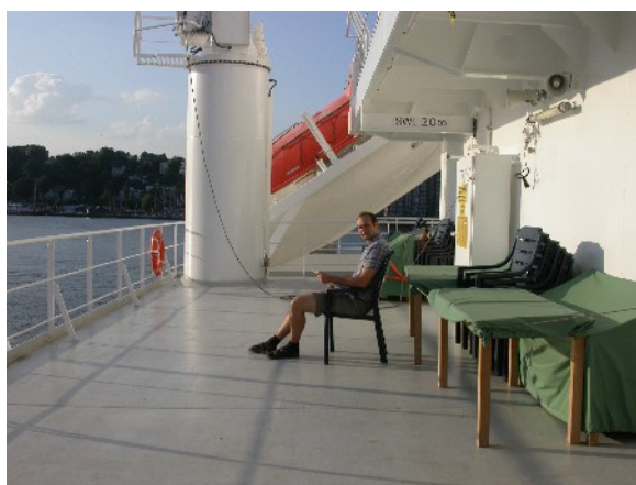
Das Freideck auf dem 4. Deck