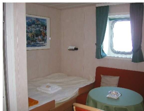
Blick in eine der Einzelkabine. Der Schreibtisch befindet sich rechts vom Tischchen