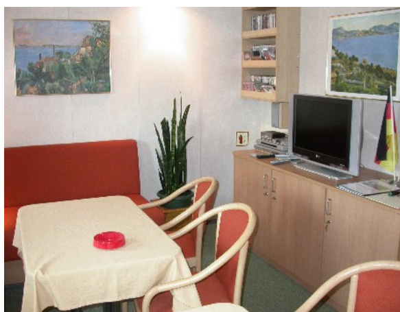
Der Aufenthaltsraum der Offiziere