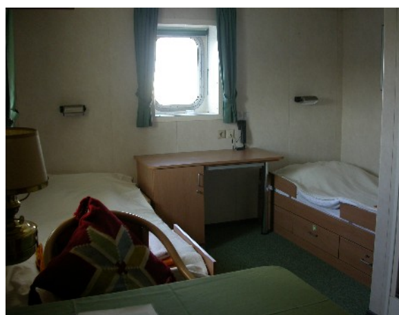
Blick in eine der Zweibettkabinen