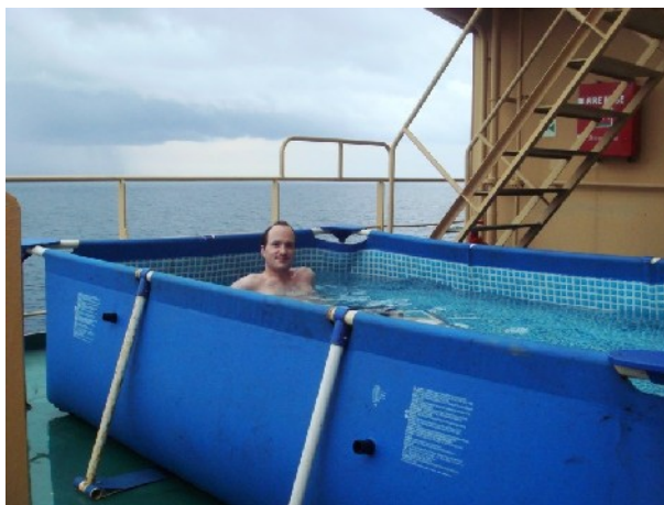
Aussenpool (nicht zwingend vorhanden)