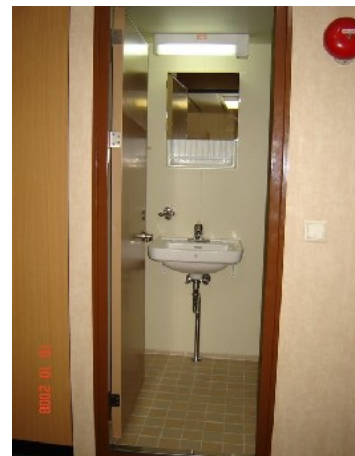
Nasszelle der Eigenerkabine