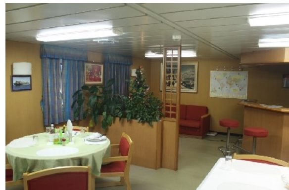
Offiziersmesse, wo auch die Passagiere essen