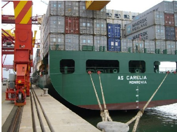
Erster Blick auf das Schiff