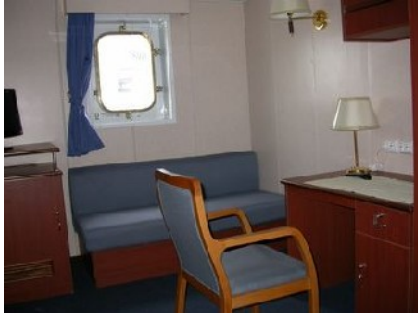
Wohnraum Eigner 404