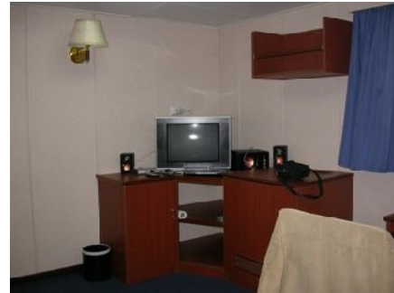
TV/DVD-Player in Eigner 402