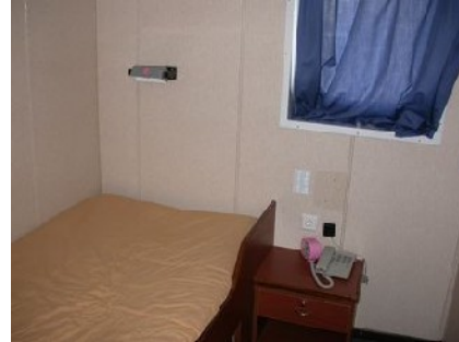
Schlafraum Eigner 404