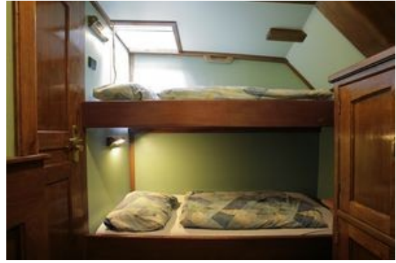
Blick in eine der Kabinen