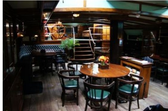
Die gemütliche Barecke in der Lounge