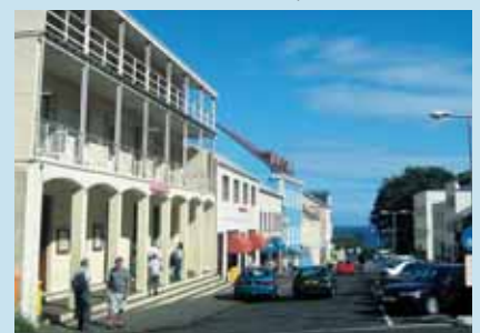
Hauptstrasse in Jamestown

Sie geniessen die Zeit an Bord. Den einen oder anderen der einheimischen Passagiere haben Sie vielleicht während Ihres Aufenthaltes auf St. Helena getroffen, viele bekannte Gesichter von Mitpassagieren und Mannschaft geben Ihnen das Gefühl, auf dem Schiff zu Hause zu sein. Sie verbringen letzte Stunden an Deck, bewundern nochmals den tiefschwarzen Himmel mit dem Kreuz des Südens und gönnen sich noch einmal einen Nachmittagste in der Lounge.