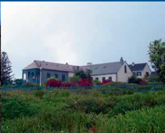
Longwood House: Napoleons Gefängnis