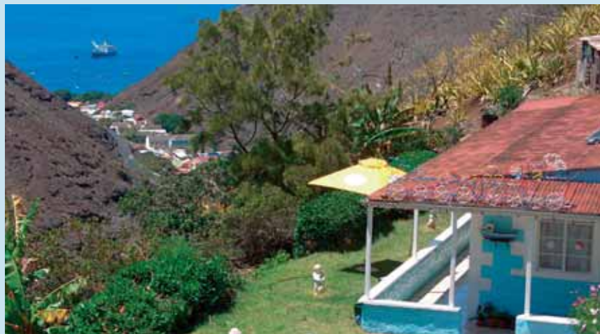
Blick vom «The Briars» in Richtung Jamestown

Der grosse Tag! Vor fast zweihundert Jahren erhaschte Napoleon fast an der gleichen Stelle seinen ersten Blick auf die Insel, die bis zu seinem Lebensende sein Gefängnis sein würde. Sie jedoch werden als gern gesehener