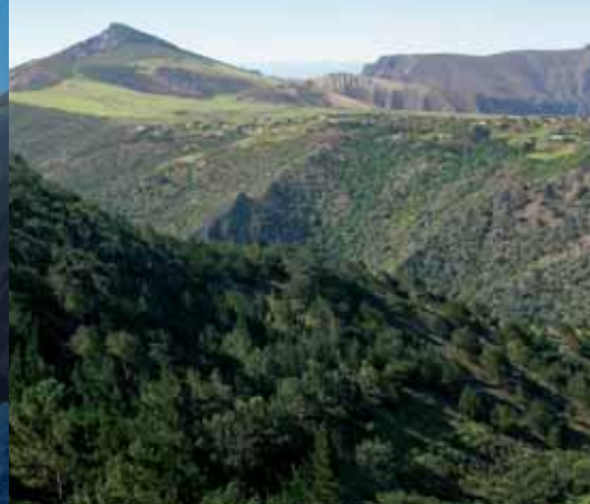
Blick in Richtung Flagstaff Hill

Gast auf der Insel aufgenommen. Im Verlaufe des Tages Ausschiffung mit Tenderbooten. Am Kai werden Sie von Ihrem Gastgeber erwartet und in die im Zentrum gelegene Unterkunft gefahren. Während Ihres Aufenthaltes wohnen Sie in einem zentral gelegenen Hotel mit Halbpension.