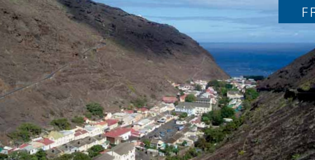
Der Hauptort von St. Helena: Jamestown