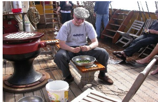
Küchendienst an Deck gehört auch zu den Aufgaben