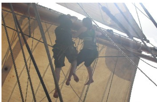
Das Arbeiten in den Masten ist für die Teilnehmer freiwillig.