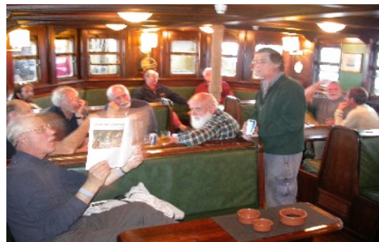
Das gemütliche "Deckhouse" ist ein beliebter Treffpunkt vor dem Nachtesen