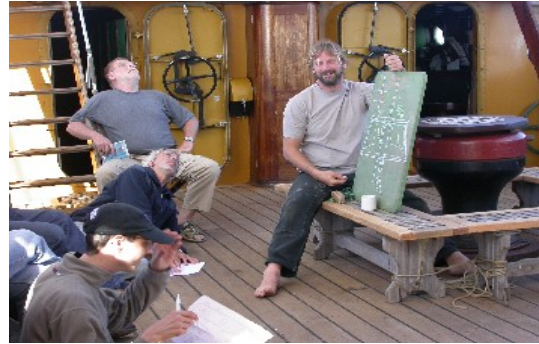
Ein Teil des Erlebnisses: Der Kapitän erklärt, wie die Segel gesetzt werden