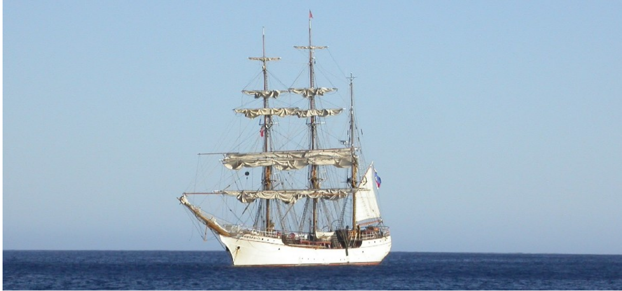
Die Europa auf Reede vor St. Helena