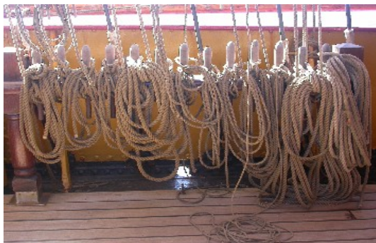
Hier die Übersicht zu behalten ist nicht ganz einfach!