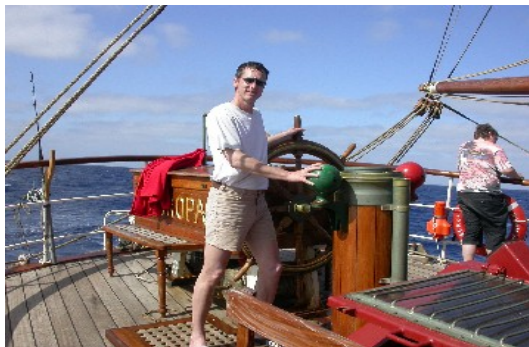
Während des Wachdienstes gehört auch das Steuern des Schiffes zu den Aufgaben