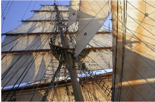
Ein fantastischer Anblick und ein tolles Gefühl, nur mit Windkraft unterwegs zu sein