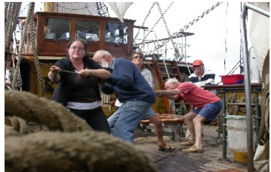
Das Hissen eines Segels ist Teamarbeit