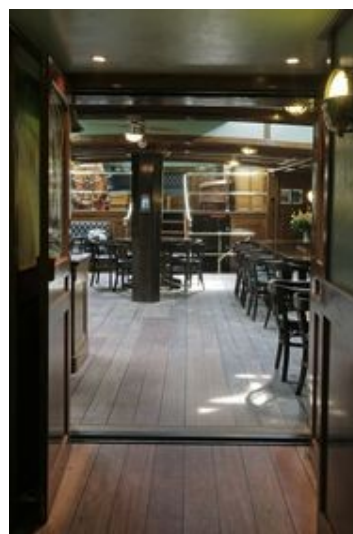
Blick in Richtung Lounge