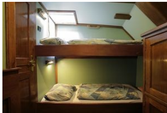
Blick in eine der Kabinen