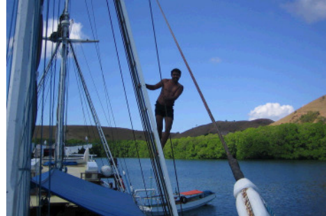
Vor Anker in einer der vielen Buchten