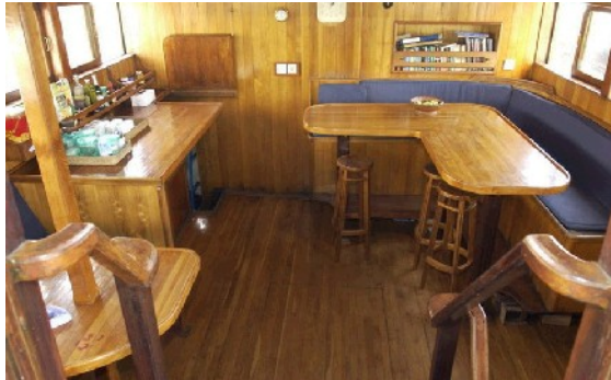
Der kleine Loungebereich