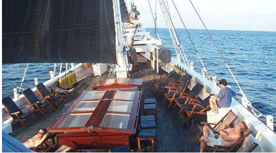
Das Deck der Katharina