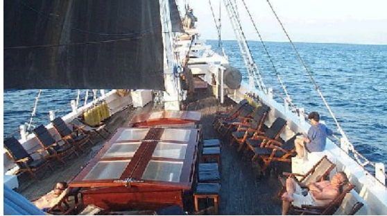
Das Deck der Katharina