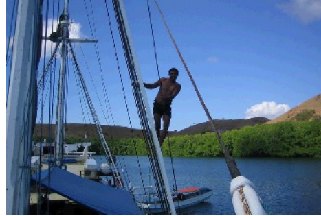
Vor Anker in einer der vielen Buchten