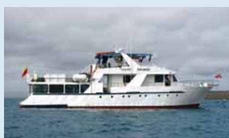
Ihr Schiff: die Floreana

Am frühen Morgen Ankunft in Europa und Weiterflug in Richtung Zürich, wo Sie am Vormittag landen. Individuelle Heimreise.