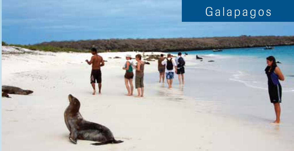
Auch die herrlichen Strände sind eine Attraktion der Galapagos-Inseln