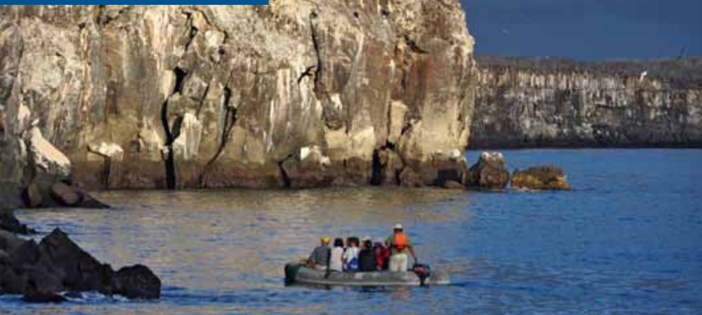
Küste der nördlichen Insel Genovesa