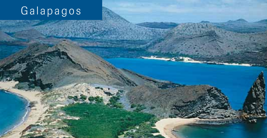
Aussicht auf Bartolomé und Santiago