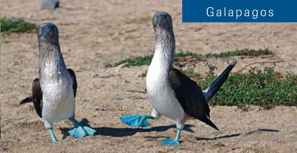
Rufusstöpel leben nur auf der Insel Genovesa