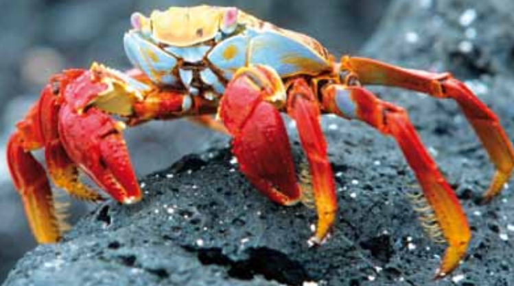
Überall auf Galapagos anzutreffen: Die rote Klippenkrabbe