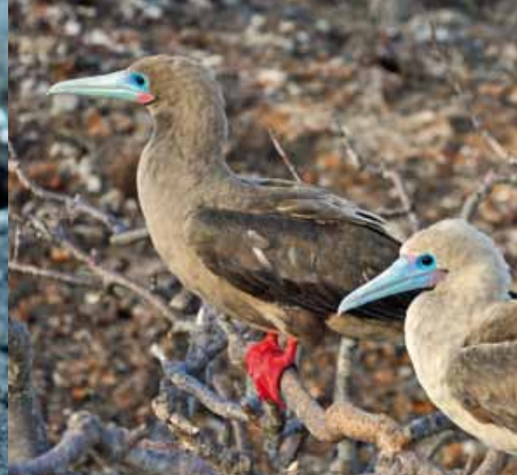
Rotfusstöpel auf Genovesa