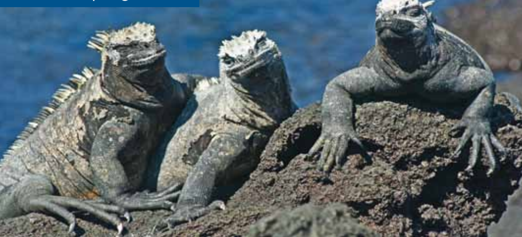
Meerechsen sind gesellige Tiere