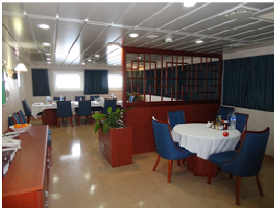
Offiziersmesse (runder Tisch = Tisch für Passagiere)