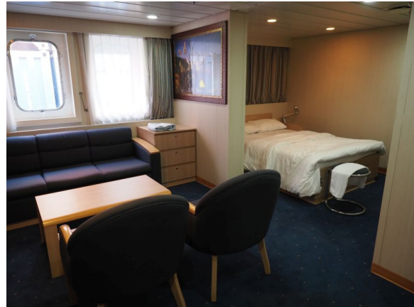
Doppelkabine mit einem Doppelbett