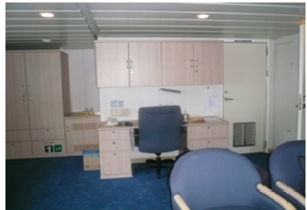
Schreibtisch in einer Doppelkabine