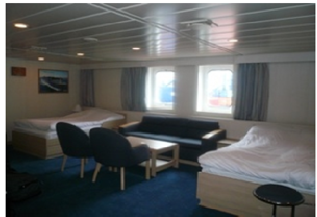
Doppelkabine mit zwei Einzelbetten