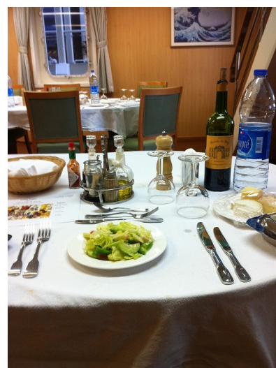
Angerichtet zum Abendessen