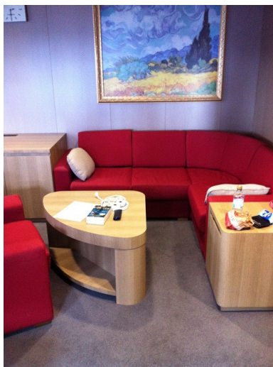
Sitzecke im Wohnraum