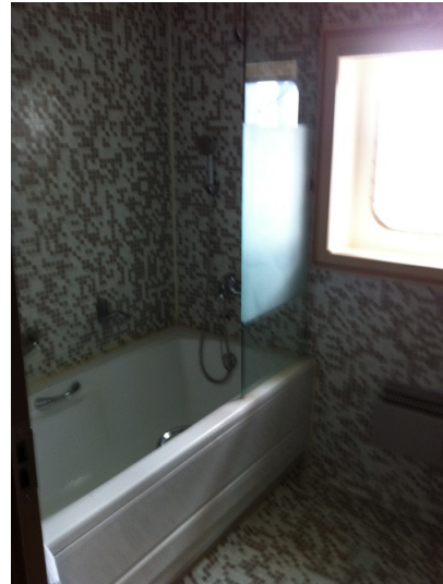
In der Nasszelle hat es auch eine Badewanne...