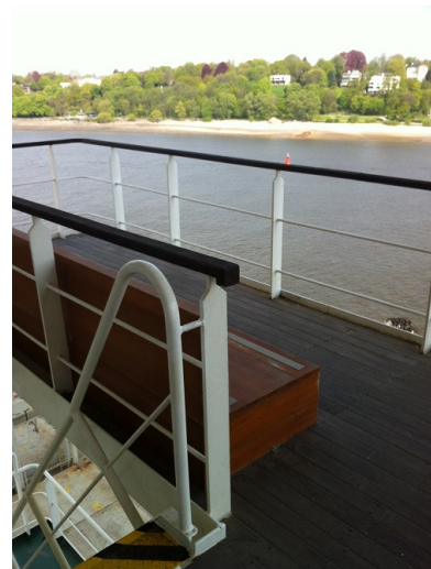
...und vor der Kabine einen kleinen Balkon