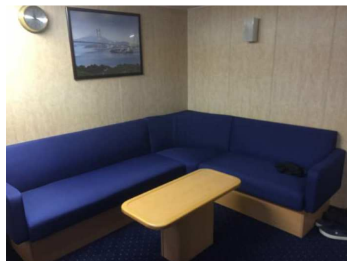
Sitzecke in der Passagierkabine