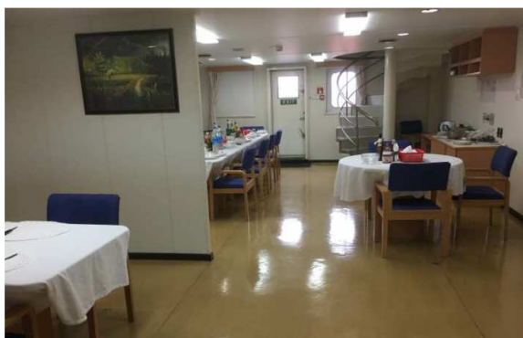
Offiziersmesse, wo die Passagiere essen