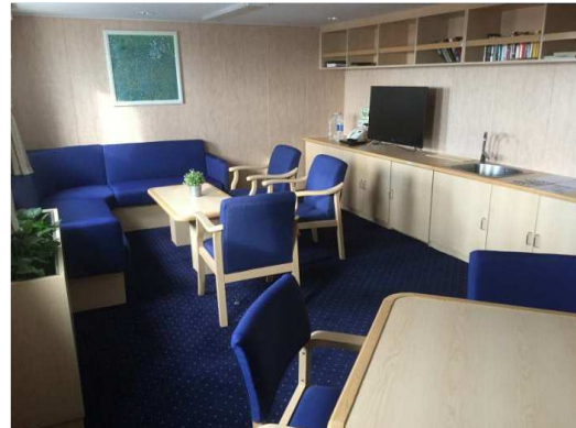
Aufenthaltsraum der Passagiere