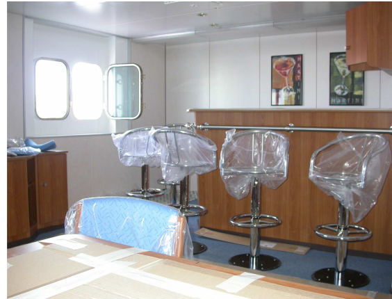
Die Bar im Aufenthaltsraum