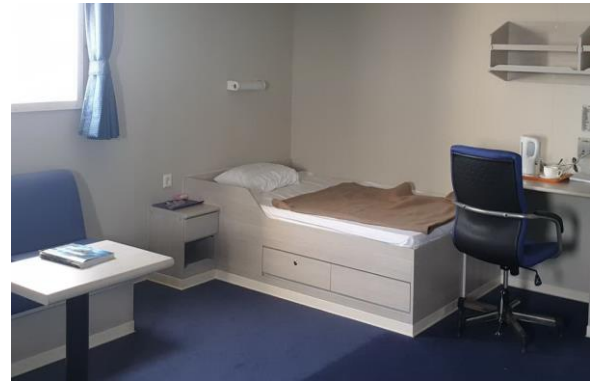
Doppelkabine ( ca. 28 qm )