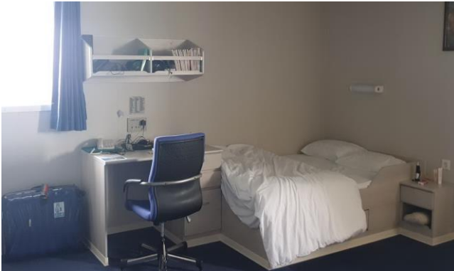
Doppelkabine ( ca. 28 qm )