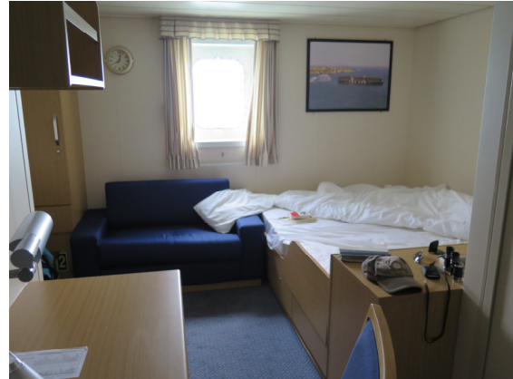
Blick in eine der Doppelkabine