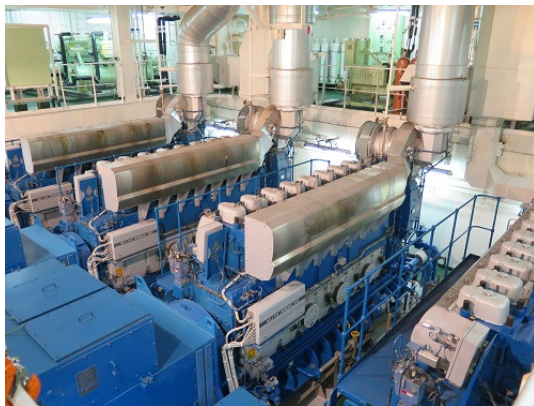
Besuch im Maschinenraum