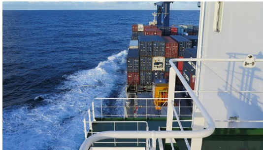
Blick nach vorne vom Deck