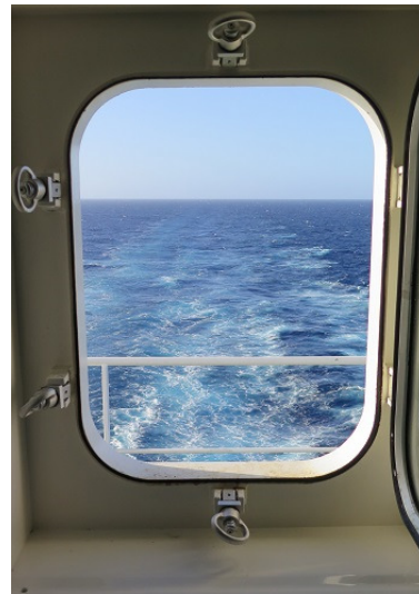
Blick aus der Kabine nach achtern