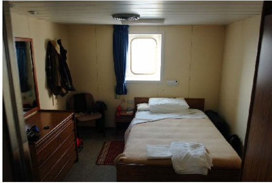
Der Schlafraum der Eignerkabine