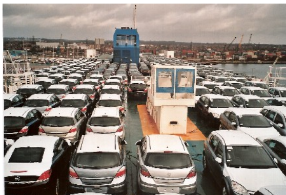
Blick vom Passagierdeck auf das oberste Autodeck