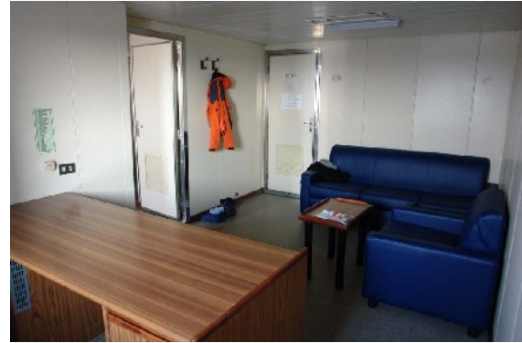
Der Wohnraum der Eignerkabine