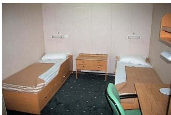
Eine der Innenkabinen