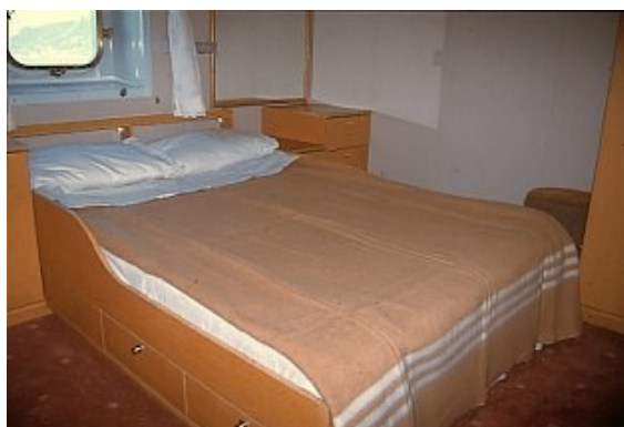
Der Schlafraum der Eignerkabine