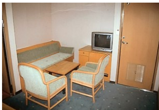
Der Wohnraum der Eignerkabine