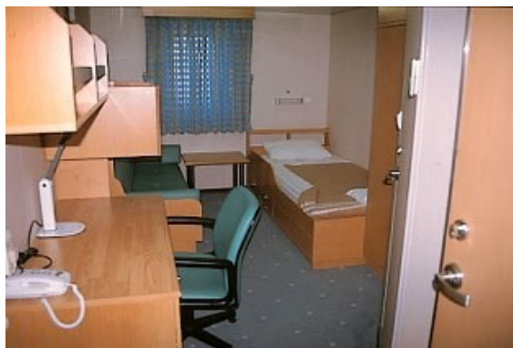
Die Doppel-Aussenkabine mit dem Bettsofa links