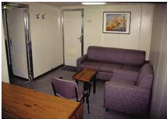
Der Wohnraum der Eignerkabine