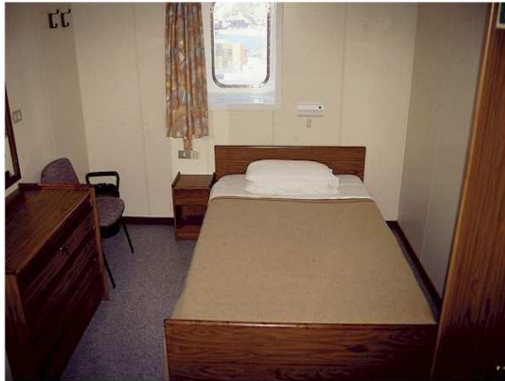
Blick in den Schlafraum der Eignerkabine