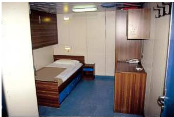
Ansicht einer Innenkabine mit unterer/oberer Koje