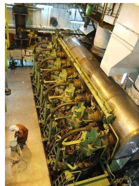
Blick in den Maschinenraum