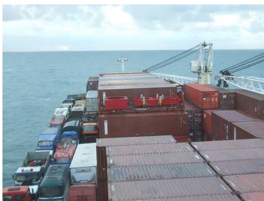
Sicht von der Kommandobrücke