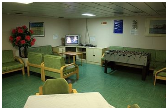
Aufenthaltsraum für die Passagiere