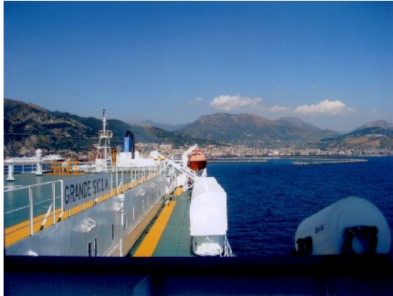
Blick auf die „Dachterrasse“ und die darunter liegenden Passagierkabinen