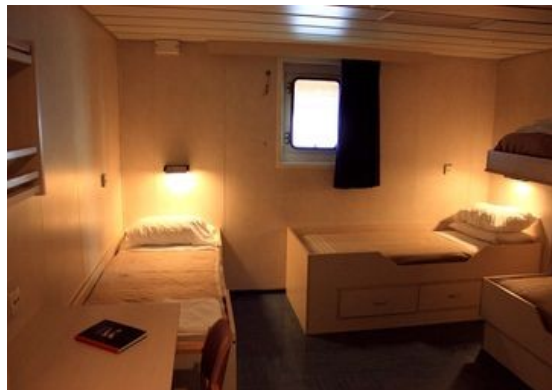
Blick in eine der Kabinen. Die Kojen 3 und 4 (Stockwerkbetten) befinden sich ganz rechts