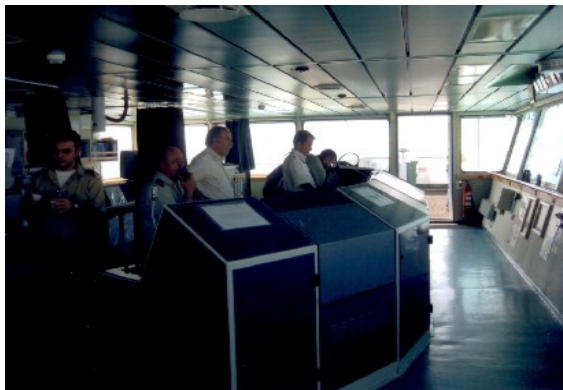
Hochbetrieb auf der Kommandobrücke