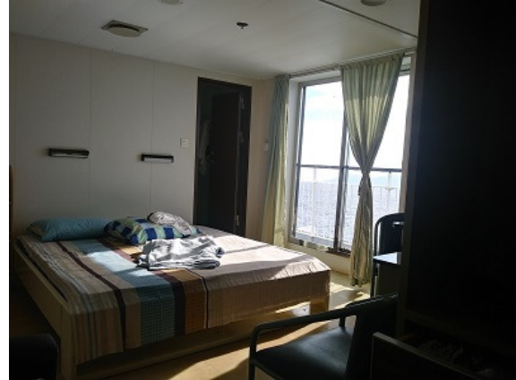
Kabine Vice Amiral