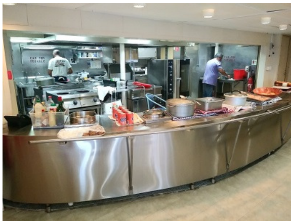
Speisesaal: Die Eiiinheimischen holen sich das Essen selber, internationale Gäste wird das Essen am Tisch serviert