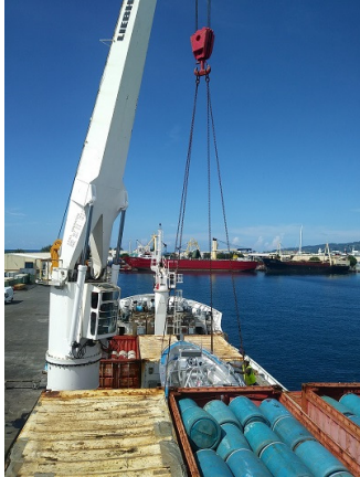
Laden an der Kai