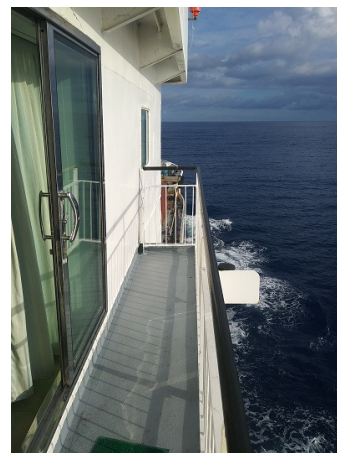
Blick auf den schmalen Balkon