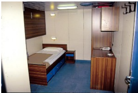
Ansicht einer Innenkabine mit unterer/oberer Koje