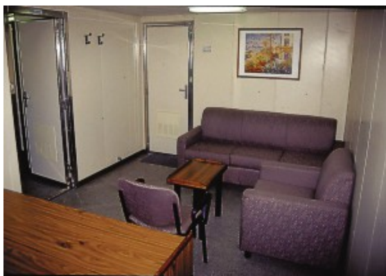
Der Wohnraum der Eignerkabine