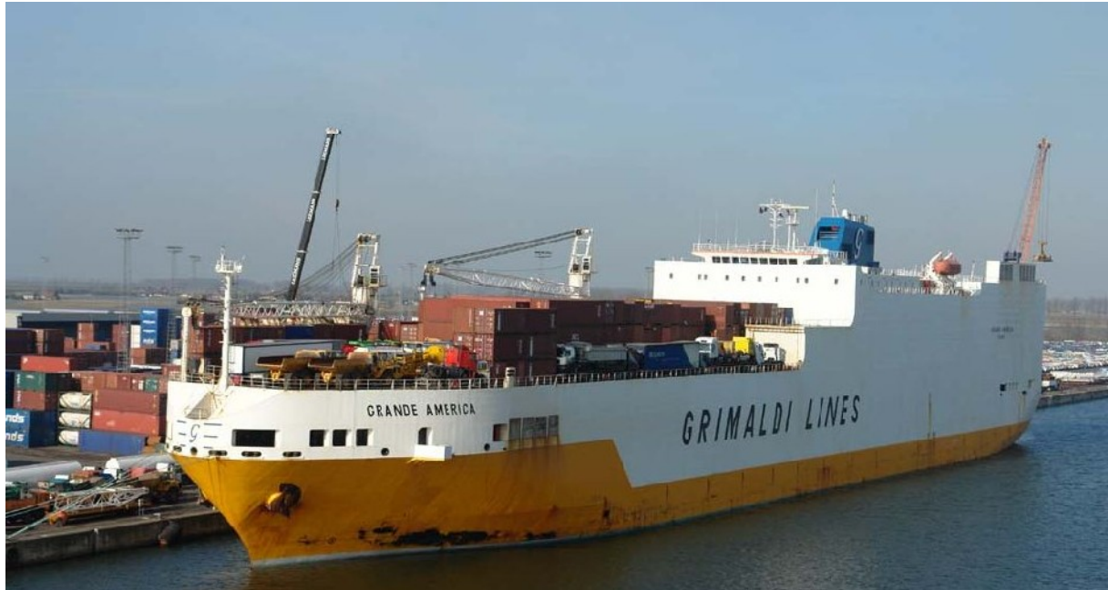
Die Grande America