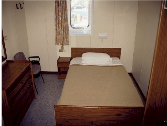
Blick in den Schlafraum der Eignerkabine