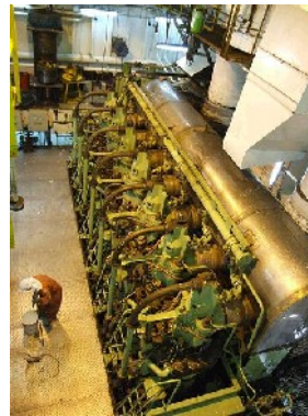
Blick in den Maschinenraum