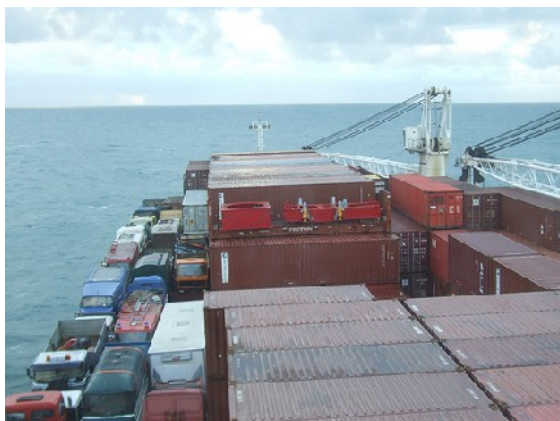
Sicht von der Kommandobrücke